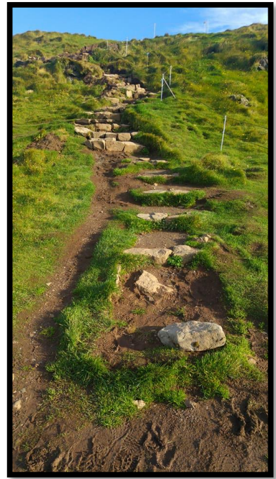
Mynd 17: tröppur í Smáhömrum við Ritugjá september 2017.

Tröppur í Smáhömrum við Ritugjá eru of þröngar og anna illa umferðinni sem um þær fer. Til framtíðar þarf að ganga mun betur frá þeim eða finna aðra lausn sem hentar betur. Sem fyrr segir var hluti styrks Stjórnstöðvar ferðamála sem úthlutað var sl. sumar eyrnamerktur viðgerð á tröppunum en hann dugði ekki til og einungis var um smávægilega andlitslyftingu að ræða. Það þarf að breikka uppganginn meira enda myndast þarna mikill flöskuháls þegar margir eru á svæðinu í einu. Þá leitar fólk út fyrir tröppurnar og ógnar bæði eigin öryggi í efsta hlutanum þar sem bratt er, sem og jarðgæðum undirlagsins þar sem gróður treðst niður. Þannig spillist ásýnd svæðisins enn frekar og náttúran lætur á sjá. Tröppurnar eru hluti göngustígs og hönnun þeirra og útfærsla þurfa að taka mið af náttúruvernd og ásýnd.