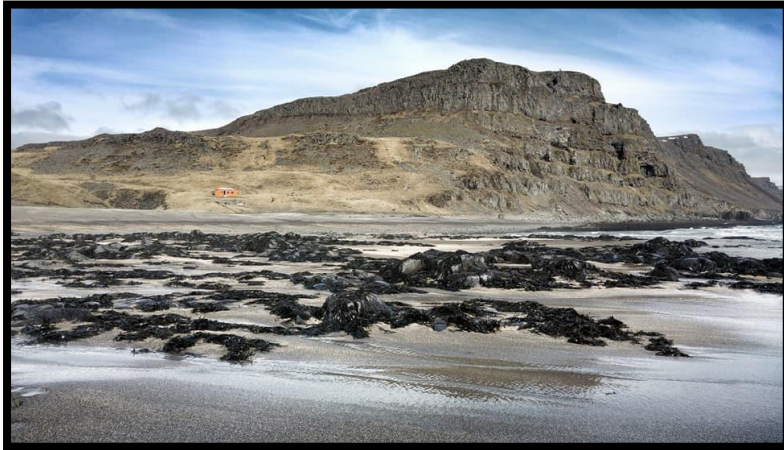
Mynd 7: Keflavík

Í júní var sett upp nýtt skilti er merkir veginn að Keflavík ófæran öðrum bifreiðum en 4x4, enda hafði það horfið einhvern tíma yfir veturinn og mun það hafa gerst áður. Einnig var staur með táknmynd sem bannar akstur bifreiða endurreistur