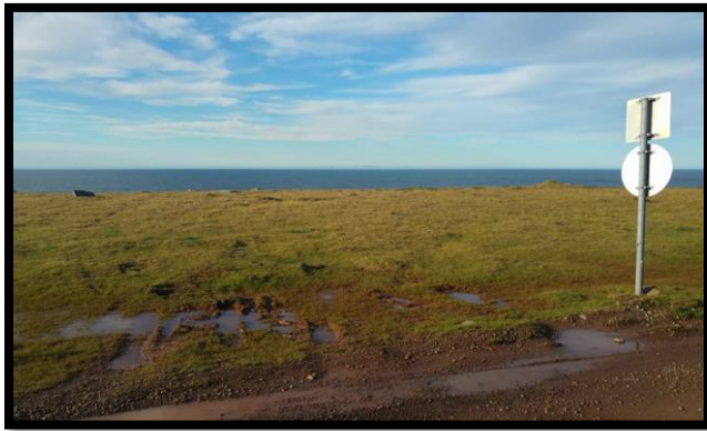
Mynd 11: hjólför og pollar við bílastæði á Bjargtöngum.

sér höndum við framkvæmdahluta þess þá er það tilfinning sérfræðings að menn séu sammála um nauðsyn þess að færa bílastæðið frá bjargbrún og stækka það í leiðinni. Það myndi bæta aðkomu að bjarginu til mikilla muna og yrði gæfuspor. Þá þyrfti óhjákvæmilega að fara í stígalagningu samhliða slíkum framkvæmdum.