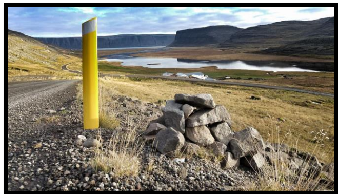
Mynd 1: teljari við veg 612. Horft niður í Örlygshöfn

Sem fyrr segir hefur hægst á aukningu umferðar út á bjarg í ár. Umferð jókst um 2% í ágúst og 7% í september milli ára 2016 og 2017 6 . Þetta eru þó vísbendingar í átt að því að ferðatímabilið sé enn heldur að teygjast fram á haustið og rímar það við tölur á öðrum viðkomustöðum á Vestfjörðum. Í talningum ársins kemur enn fremur fram að umferð um helgar eykst lítillega frá árinu á undan á kostnað umferðar á virkum dögum en umferðarpunginn eftir tíma sólarhrings breytist lítið. Flestir fara um veginn að Látrabjargi á milli klukkan 13:00 og 16:00 og stjórnast það e.t.v. að nokkru leyti af komutíma fyrri ferðar ferjunnar Baldurs að Brjánslæk 7 .