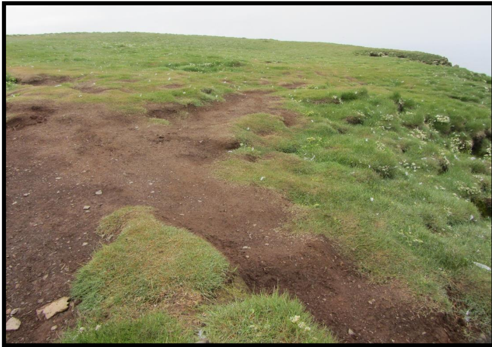
Mynd 15: við Stefnið. Mynd tekin í júní 2013.

Á „flötinni“ við Ritugjá sem markar leiðina út á Stefnið er ástandið að sama skapi orðið afar slæmt. Gróðurinn er viðkvæmur og nær ekki að jafna sig á vaxtartíma vegna þess fjölda sem fer um svæðið en Stefnið er efsti punktur göngu um 80% þeirra er sækja Látrabjarg heim. Á myndunum fyrir neðan má sjá muninn á svæðinu með fjögurra ára millibili. Eins og áður er fyrri myndin tekin sumarið 2013 og sú seinni sumarið 2017 á svipuðum stað.