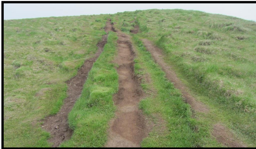
Mynd 13: troðningar ofan Ritugjár. Mynd tekin í júní 2013.

Mikil þörf er á stígalagningu og stýringu umferðar á bjargbrún. Jarðvegurinn er viðkvæmur og sundurgrafinn. Djúp sár hafa myndast og þegar rignir verður mikið forarsvað í troðningum. Þá leitar göngufólk út af troðningum á gróið land og traðkar þannig á endanum niður stærra og stærra svæði. Á stöku stað er stígurinn orðin sex- til sjöfaldur og hefur ásýnd svæðisins versnað til muna á örfáum árum. Á myndum hér fyrir neðan má sjá þá breytingu sem orðið hefur á jarðvegi skammt ofan Ritugjár á fjórum árum. Fyrri myndin er tekin sumarið 2013 og sú seinni sumarið 2017 á svipuðum stað. Báðar eru myndirnar teknar þegar veður var þurr en sem fyrr segir þá fara þessar rásir á flot í aur þegar blautt er í veðri. Þá leitar fólk út fyrir leirinn og upp á gras. Þarna myndast því á endanum breiðgata troðninga ef ekkert verður að gert.