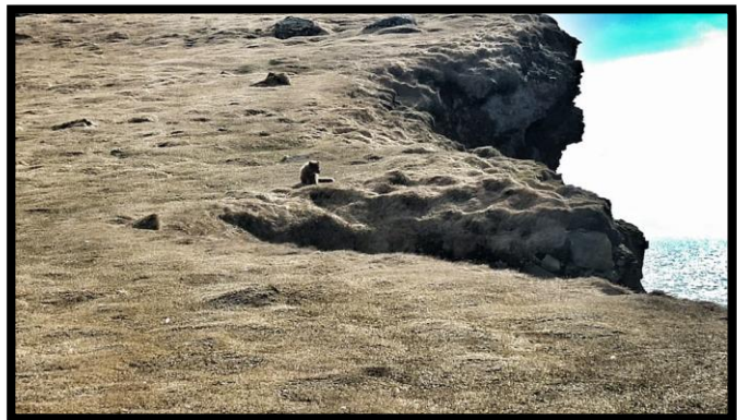
Mynd 8: refur á Látrabjargi í maí 2017.

Lundinn, sem áður þakti bjargbrúnina við Bjargtanga hefur að miklu leyti hörfað þaðan. Sumarið 2017 sáust einhverjir fuglar flesta daga, í mismiklu magni, en að sögn landeigenda hefur lundinn flutt sig um set og honum hefur fjölgað á öðrum og óaðgengilegri stöðum eins og á Látravelli og Bæjarvelli þar sem eru mikil lundaver.