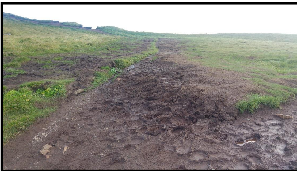
Mynd 16: við Stefnið. Mynd tekin í ágúst 2017.