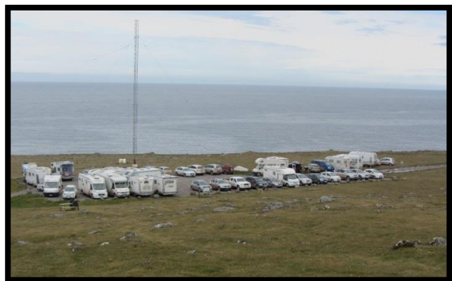
Mynd 10: bílastæði við Bjargtanga. Mynd frá 2013.

Bílastæði við Bjargtanga er sprungið fyrir allnokkru og stæðið annar fjölda ferðamanna alls ekki á háannatíma. Hópbifreiðar eiga erfitt með að snúa og grípa bílstjórar þá til þess ráðs að fara út fyrir möl og inn á gróið land enda hafa myndast ljót hjólför og djúpir pollar þar sem girðingum sleppir. Skv. nógildandi deiliskipulagi fyrir svæðið er ráðgert að færa bílastæði við Bjargtanga í austur til að minnka álag á bjargbrúnina, auka öryggi gesta og opna möguleika á hringleið göngustíga um bjargið frá bílastæði að Stefni ofan Ritugjár, niður að vita og aftur að bílastæði. Þrátt fyrir að ósætti um gildandi deiliskipulag sé til staðar hjá landeigendum og sveitarfélagið haldi að