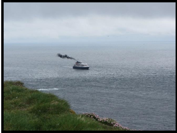
Mynd 3: skemmtiferðaskip skammt undan Látrabjargi

Sérfræðingur hefur kannað möguleika á því hjá Landhelgisgæslunni /vaktstöð siglinga að nálgast áreiðanlegur tölur um komur skipa undir bjarg og þá jafnvel hvort hægt er að flokka umferð niður eftir tegundum skipa eða fá samanburð milli ára. Slík gögn eru til, sbr. áhættumat Hornstranda sem vísað er í hér að ofan, en þau eru lögvarin þó veita megi heimild fyrir aðgangi að þeim í ákveðnum tilgangi. Úrvinnsla og framsetning