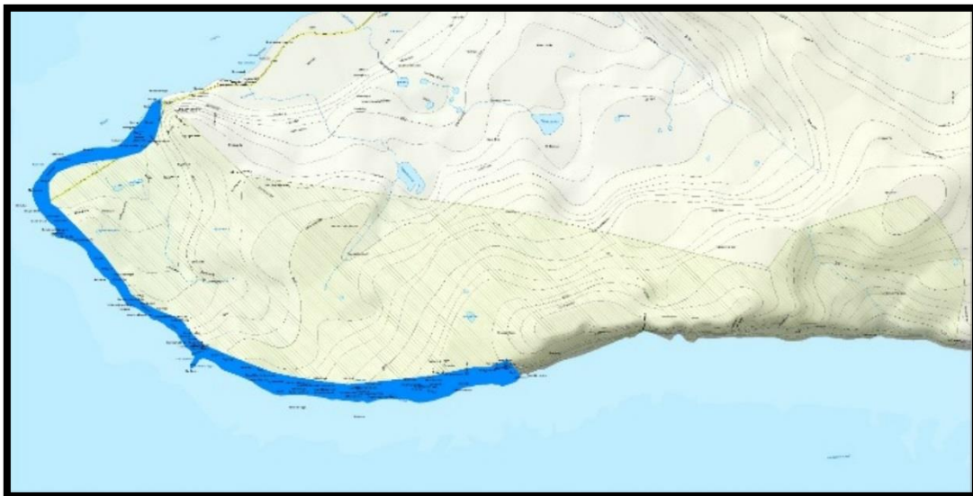
Kort 1: tillögur landeigenda að mörkum friðlýsts svæðis á Látrabjargi.

Hin tillagan hljóðaði upp á svæði er afmarkaðist af 15 metrum inn frá bjargbrún frá Seljavík sem leið liggur eftir bjarginu endilöngu að landamörkum við enda Bæjarbjargs. Tillögurnar eru sýndar á korti 1. Ljósgræna svæðið afmarkar fyrri tillöguna en bláa lína þá seinni. Athuga ber að bláa línán er ónákvæm og er einungis sett fram í sjónrænum tilgangi, orðaskýring tillögunar er nákvæmari.