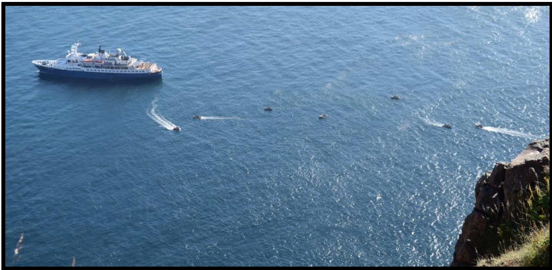
Mynd 2: skemmtiferðaskipið Island Sky undir Látrabjargi. Þarna má sjá sjö gúmmibáta á sjó. Einn maður er í fjórum bátanna sem getur bent til þess að fólk hafi verið sett í land.

Nokkuð hefur borið á komum skemmtiferðaskipa að Látrabjargi síðustu sumur og það er tilfinning landeigenda að sú umferð hafi aukist mikið í sumar sem leið. Almennt skipulag eða reglur um siglingar og landtökur skemmtiferðaskipa við Íslandsstrendur eru ekki fyrir hendi og er það áhyggjuefni. Látrabjarg er mikilvæg varpstöð margra fuglategunda og nokkrar þeirra ná alþjóðlegum verndarviðmiðum. Skip kasta gjarnan akkerum stutt undan bjargi og ferja svo fólk að landi á litlum gúmmibátum eftirlitslaust. Það má leiða líkum að því að í einhverjum tilfellum sé um landtöku að ræða þó erfitt sé að fylgjast með því af bjarginu og ekki er eftirliti frá sjó fyrir að fara.