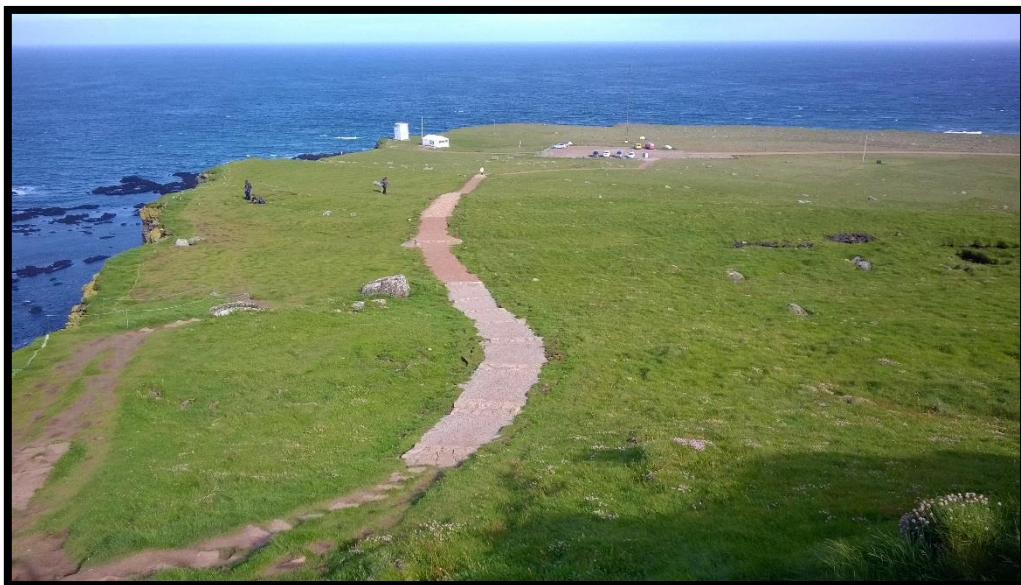
Mynd 12: göngustígur sem lagður var árið 2015 og liggur frá núverandi bílastæði í átt að Ritugjá.

stíginn bæði á upp- og niðurleið en aðrir nota hann sem hluta hringleiðar. Þá er gengið upp stíginn að Ritugjá og meðfram bjarginu niður að vita, eða öfugt. Bjargbrúnin frá vita að Ritugjá ber þess merki að þar er minna álag en þegar ofar dregur þar sem engum eiginlegum stíg er til að dreifa. Jarðvegsskemmdir og traðk eru minna áberandi þar en ofan Ritugjár. Þó ber að athuga að meira álag er einnig af völdum fuglsins á jarðveg ofan Ritugjár en á svæðinu frá vita að gjá.