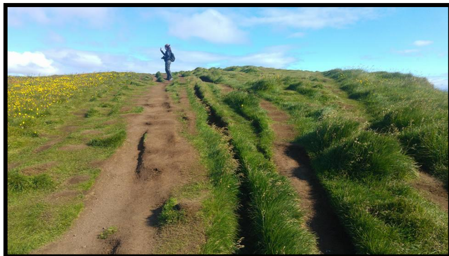
Mynd 14: troðningar ofan Ritugjár. Mynd tekin í ágúst 2017.