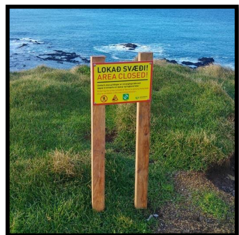
Mynd 6: leiðbeinandi skilti við bjargbrún.

Það er mat þeirra sem að verkinu komu að girðingin þjóni hlutverki sínu vel og flestir ferðamenn virða hana þó vissulega hafi þurft að hafa afskipti af fólki sem fór út fyrir hana. Það er aldrei hægt að koma í veg fyrir slíkt ef brotaviljinn er einlægur en fólk er þó upplýst um þá áhættu sem tekin er. Girðingin þjónar bæði kröfum um öryggi ferðamanna auk þess sem fuglinum er helguð ysta bjargbrúnin. Þannig fara saman öryggisatriði og náttúruvernd og er það vel. Rétt væri að setja upp skilti við Ritugjá þar sem