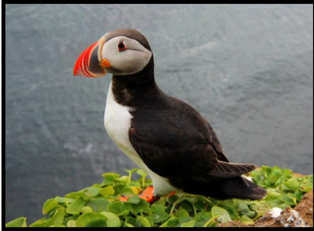
Mynd 9: lundi við Bjargtanga

Náttúrustofa Norðausturlands hefur undanfarin ár vaktað varpárangur fýls, ritu, langvíu og stuttnefju á Látrabjargi. Við Ritugjá er vöktunarmyndavél á Stefni og landvörður leit til með henni á ferðum sínum í sumar. Náttúrustofa er enn að vinna úr gögnum sem aflað var sumarið 2017 en gerir ráð fyrir að tölur liggi fyrir í lok janúar 2018 16